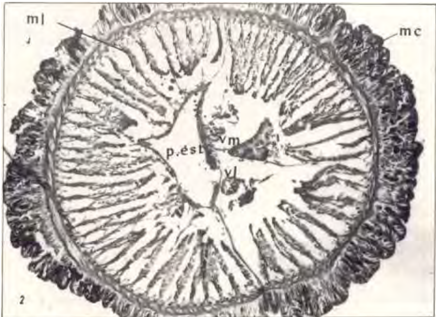
FOTO 1. Corte transversal de lofóforo al nivel tentacular.

FOTO 2. Corte transversal a nivel de la región muscular: p.ést = pre-estómago; i = intestino; mc = músculo circular; ml = músculo longitudinal; vm = vaso medio; vl = vaso lateral; m = mesentéridos.